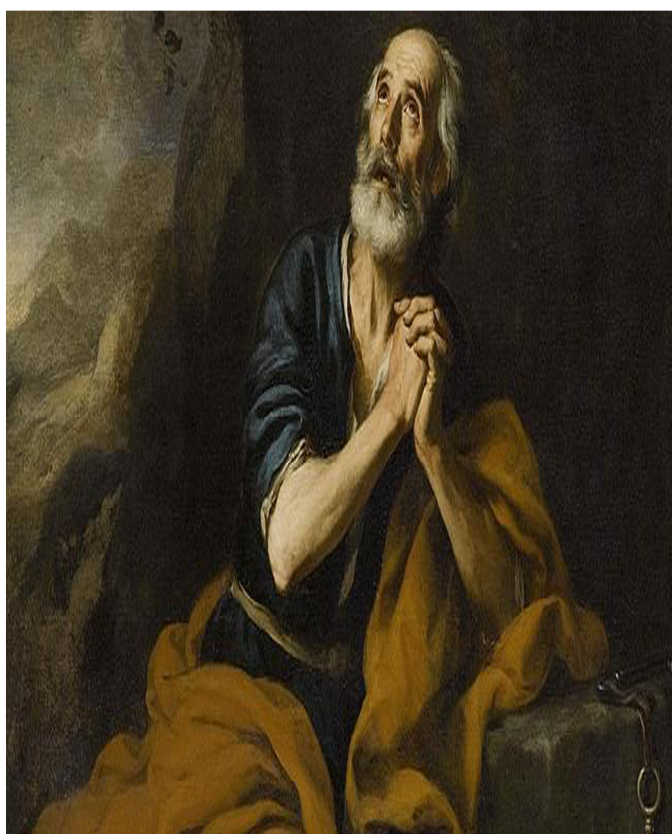
2.- San Pedro penitente. 1665-1670. Bartolomé Esteban Murillo. Fundación Fondo de Cultura de Sevilla

Por ello desde el Grupo Scout Kolonia de BP 347, invitamos a todo el mundo a conocer la obra de estos grandes autores y disfrutar de las breves ocasiones en las que podemos contar en nuestro país con exposiciones de este calibre. Así mismo no dejamos de recomendar la visita a las exposiciones permanentes situadas en museos por toda la geografía nacional para maravillarnos con la belleza del arte del pasado y conocer cómo esos autores plasmaban la realidad contemporánea.