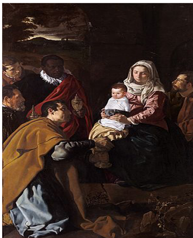
3.- Adoración de los Reyes Magos. 1619. Diego Velázquez. Museo Nacional del Prado