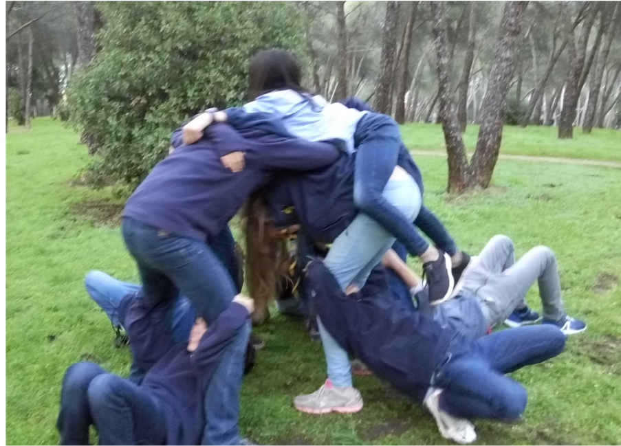
Troperos jugando al juego de la estrella. ¡No probar en casa, hay riesgo de desnucamiento!

Con todo ello nos lanzamos a la ronda y aunque las primeras reuniones se hayan visto truncadas por el tiempo, estamos deseosos de enfundarnos las botas, ceñirnos el macuto y juntos subir cantando la montaña para hacer noche en la cima. Sabemos que será cansado y probablemente que llueva, ¡pero nada puede parar a la Tropa Scout Impeesa!