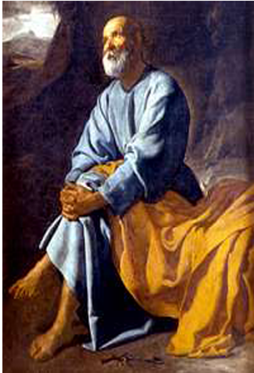
-1.- Las lágrimas de San Pedro. H. 1620. Diego Velázquez. Fondo Cultural Villar Mir

Estos últimos meses y hasta finales de enero podemos encontrar en el Museo Thyssen de Madrid una de las obras más increíbles y personales con las que cuenta la pintura europea. A finales del siglo XIX y principios del XX el impresionismo era la tendencia pictórica en auge y uno de sus más importantes representantes es el pintor francés Pierre-Auguste Renoir. La exposición destaca el papel central que ocupan las sensaciones táctiles en los lienzos que pueden percibirse en las distintas etapas de su trayectoria y en una amplia variedad de géneros, tanto en escenas de grupo, retratos y desnudos como en naturalezas muertas y paisajes. El museo nos ofrece un recorrido por más de 70 obras del artista francés, procedentes de museos y colecciones de todo el mundo, permite descubrir cómo se servía de las sugerencias táctiles de volumen, materia o texturas como vehículo para plasmar la intimidad en sus diversas formas (social, amistosa, familiar o erótica), y cómo ese imaginario vincula obra y espectador con la sensualidad de la pincelada y la superficie pictórica.